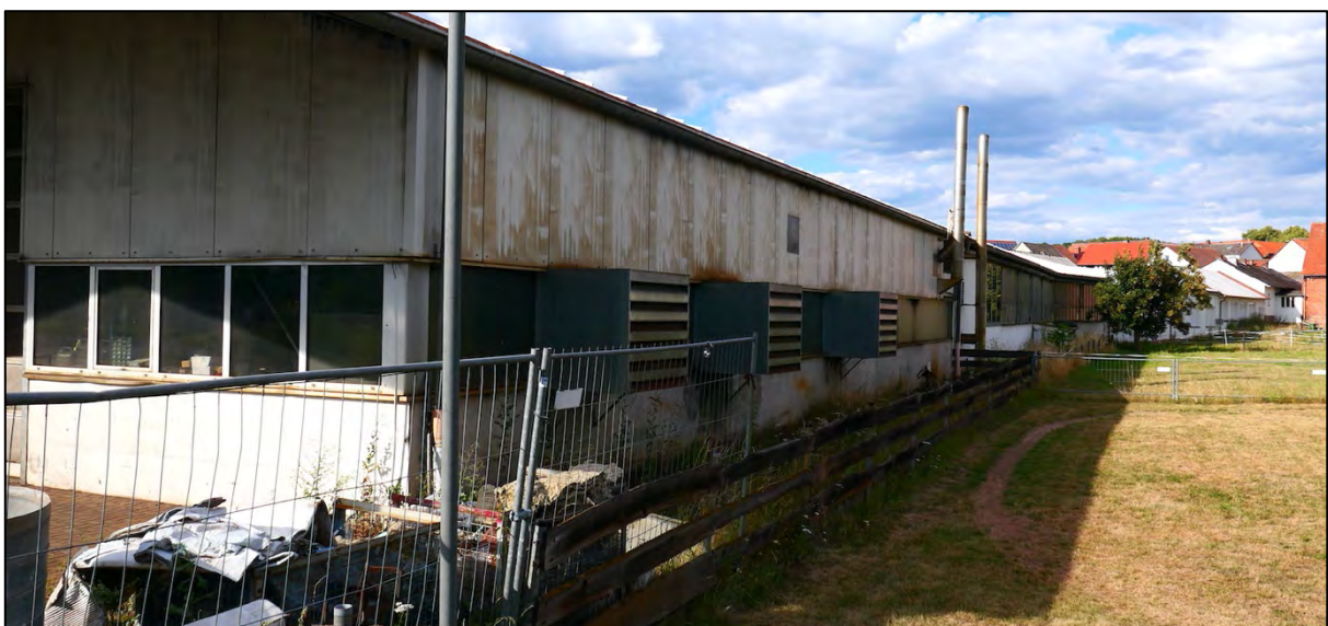
Abbildung 3: Hallenfront an der Grundstücksgrenze zu Pferdekoppeln im Osten