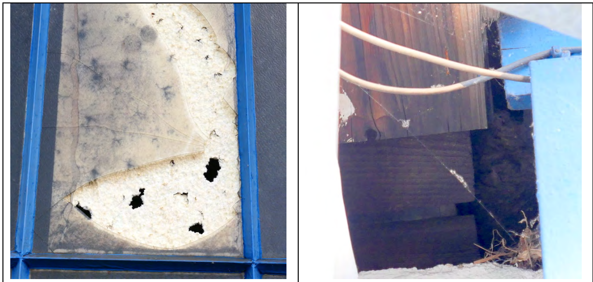
Abbildung 6: Provisorische Fensterreparatur mit Meisenbearbeitung, Nischennest unter Dachanschluss Mitte-Ost