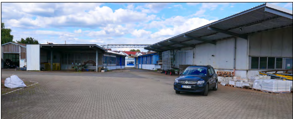
Abbildung 2: Neuere Hallen des Gewerbe-Ensembles von der Bahnseite im Westen