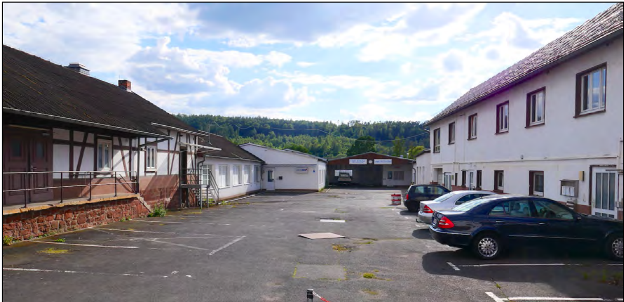
Abbildung 1: Altbebauung des Gewerbe-Ensembles von der Ohmtalstraße im Osten