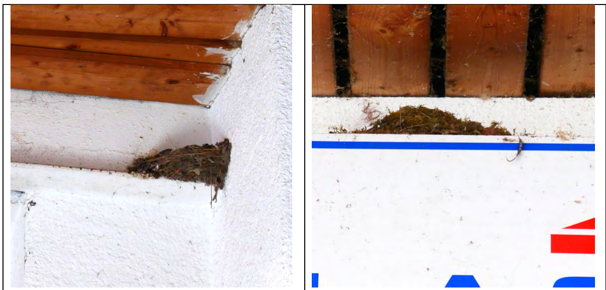
Abbildung 7: Nischennester auf Gesimsen