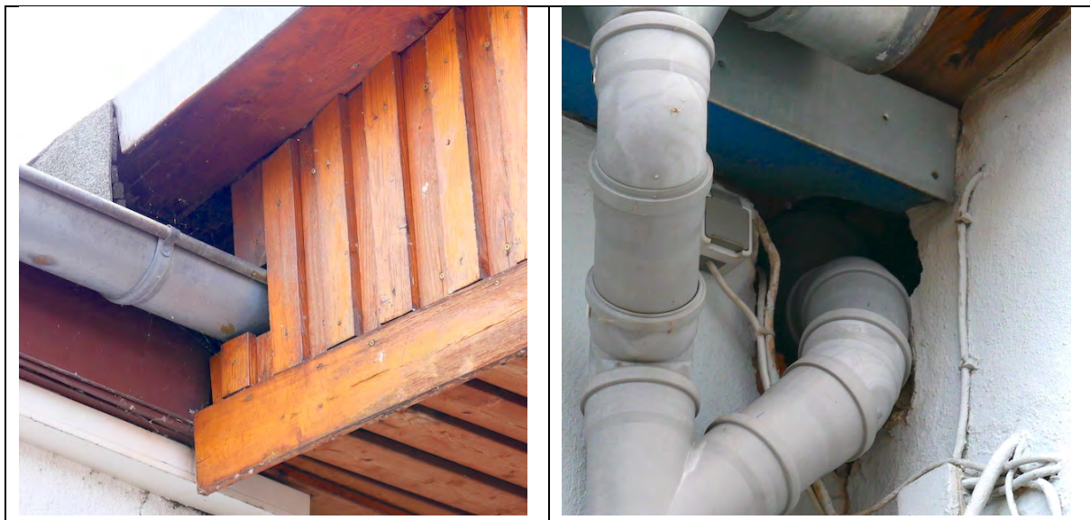
Abbildung 5: Dachstöße mit unvollständig geschlossenen Fassaden im Bereich Mitte-Ost