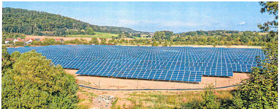
Blick aus südlicher Richtung auf den Solaracker Cölbe.