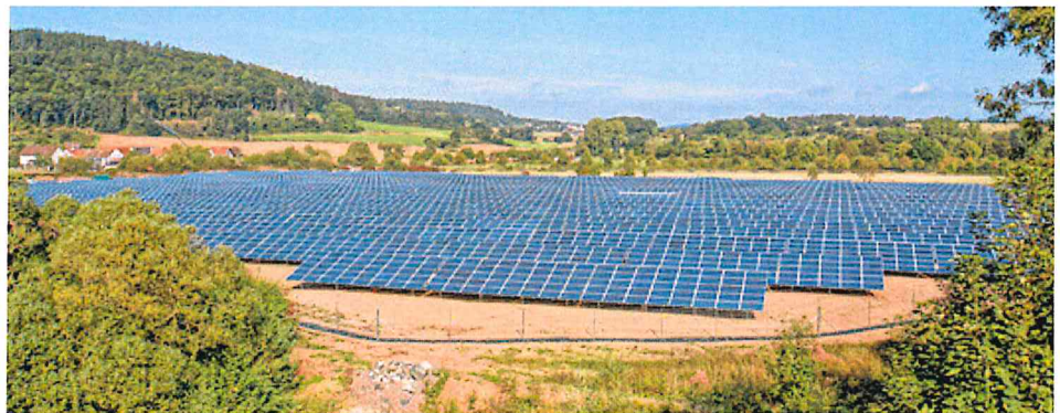
Blick aus südlicher Richtung auf den Solaracker Cölbe.