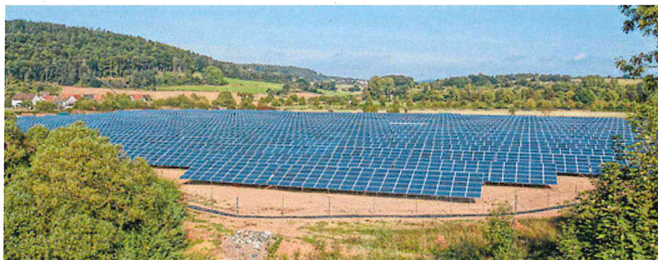
Blick aus südlicher Richtung auf den Solaracker Cölbe.