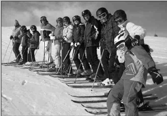
Das Bild zeigt einen kleinen Teil der Skifahrer beim Zwischenstopp.

Es war eine tolle und erfolgreiche Fahrt, bei der die 51 Skifahrer, Snowboarder, Langläufer und Wanderer, jung und „älter“, nicht nur aus Schönstadt, an 6 Tagen viel Sonne tanken und den Schnee genießen konnten. Alle waren sich im Rückblick einig, dass sie gerne auch im kommenden Jahr wieder eine vergleichbare Fahrt machen würden. In der gesamten Gruppe herrschte eine tolle Stimmung und es wurde für alle Altersklassen etwas geboten. Langeweile kam nie auf. Im Schnee konnten sich alle austoben und auch die absoluten Anfänger auf Ski oder Snowboard haben die angebotenen Kurse reichlich genutzt und in der einen Woche tolle Erfolge erzielt. Glückwunsch noch einmal hierzu!