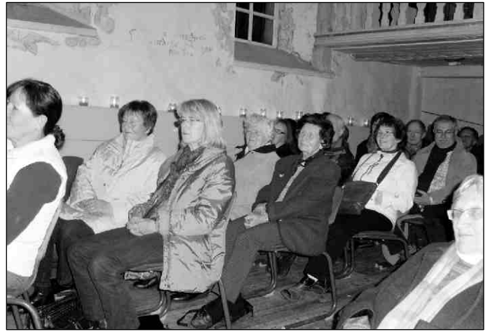
Blick in das zahlreich erschienene Publikum.