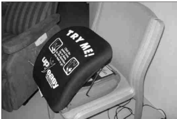
Ein Beispiel einer Aufstehhilfe

Wohnberatung für ältere und für Menschen mit Behinderung. Immer geht es darum das Leben zu gestalten, trotz Einschränkungen. Vielleicht kann ich Ihnen bei Ihren