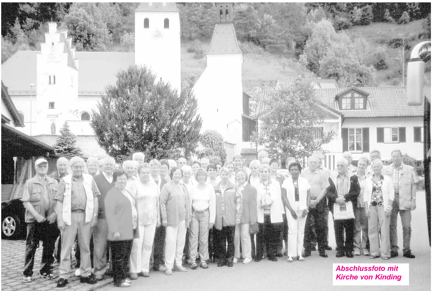
Abschlussfoto mit Kirche von Kinding

Info für Vereine, Verbände, Initiativen: Bitte schicken Sie Ihre Texte und Bilder direkt an den Grundblick-Verlag: Vor dem Wald 16, 35085 Ebsdorfergrund-Wittelsberg, E-Mail: post@grundblick.de Eine Abgabe bei der Gemeinde ist nicht möglich! Bei längeren Texten, die nicht per Mail geschickt werden, kann eine Veröffentlichung nicht garantiert werden. Annahmeschluss: Ausgabe 15/2009: Mo. 13.7.09