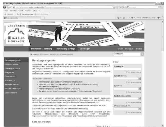
Der neue Online-Pflegekompass ergänzt das Beratungs- und Service-Angebot des Landkreises Marburg-Biedenkopf.