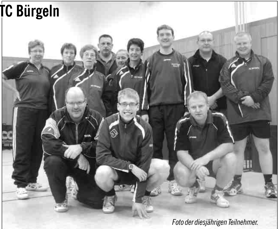
Foto der diesjährigen Teilnehmer.

Nach einer gelungenen Veranstaltung wurde am Abend in der Flugplatzgaststätte Schönstadt die Siegerehrung angemessen gefeiert.