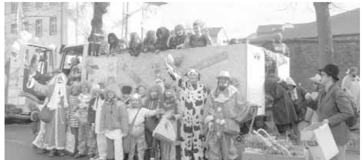
Die Cölber Jecken vor ihrem Rosenmontagswagen

Die Vorstellung, dass 12.000 Menschen (Info der Marburger Polizei) den Rosenmontagsumzug an den Straßenrändern verfolgt haben, ist für die Cölber Jecken kaum zu glauben. Es hat allen - Schulkindern und Eltern - viel Spaß gemacht und fast alle Kinder wollten am Zugende im Afföller wissen, ob die Lindenschule auch 2010 wieder beim Rosenmontagsumzug mitmacht. Diese und andere Aktionen des Fördervereins, wie beispielsweise die Ferienbetreuung, werden nur durch aktive Mitglieder ermöglicht. Um die Schulgemein-