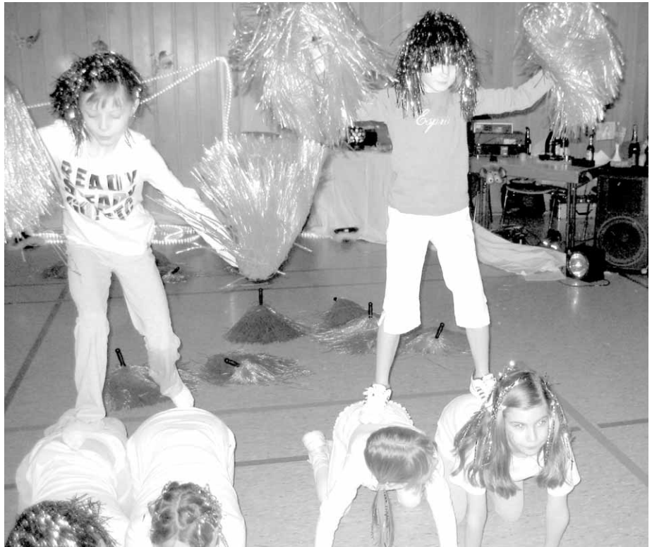
Foto: Kinderfasching des Turnverein Schwarz Weiß Bürgeln am 22. Februar in der Mehrzweckhalle